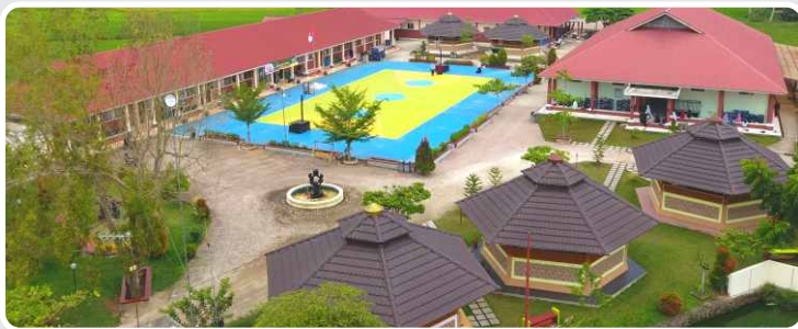
📍 ICBS Komplek Harau Putri

Jorong Ketinggian Nagari Sarilamak Harau, Limapuluh Kota, Sumatera Barat