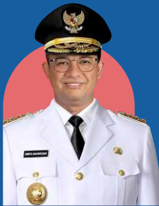
H. Anies Rosyid Baswedan, S.E., M.P.P., Ph.D (Gubernur DKI Jakarta 2017 - 2022)

ICBS merupakan ekosistem pendidikan yang mampu meningkatkan kemampuan, melatih kemandirian, dan menumbuhkan karakter dan pribadi yang cerdas, Islami dan berprestasi.