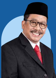
Drs. H. Zainut Tauhid Sa'adi, M.Si (Wakil Menteri Agama RI)

ICBS merupakan ekosistem pendidikan yang mampu meningkatkan kemampuan, melatih kemandirian, dan menumbuhkan karakter dan pribadi yang cerdas, Islami dan berprestasi.