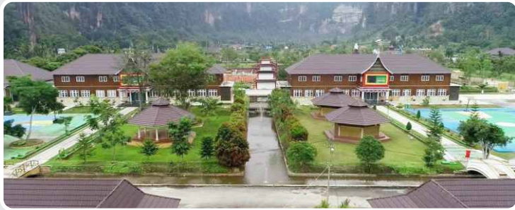
📍 ICBS Komplek Harau Putra

“Allah akan meninggikan orang-orang yang beriman di antaramu dan orang-orang yang diberi ilmu pengetahuan beberapa derajat.” (QS. Al Mujadalah : 11)