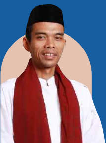
Ustadz Prof. H. Abdul Somad Batubara, Lc., D. E. S. A., Ph.D (Da'i Nasional)

ICBS merupakan lembaga pendidikan Islam hasil dari pemikiran visioner. Dengan visi dan ambisi yang luar biasa, ICBS berhasil menjadi salah satu Lembaga pendidikan terbaik di Indonesia.