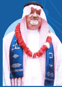
Syaikh 'Isham 'Abid Ats Tsaqafy (Duta Besar Kerjaan Arab Saudi Untuk Indonesia)

ICBS merupakan Boarding School yang sangat unik, terletak dilokasi yang dikelilingi banyak bebatuan yang keras namun terdapat santri-santri yang berhati lembut yang sedang mempelajari Ilmu Al-Quran.