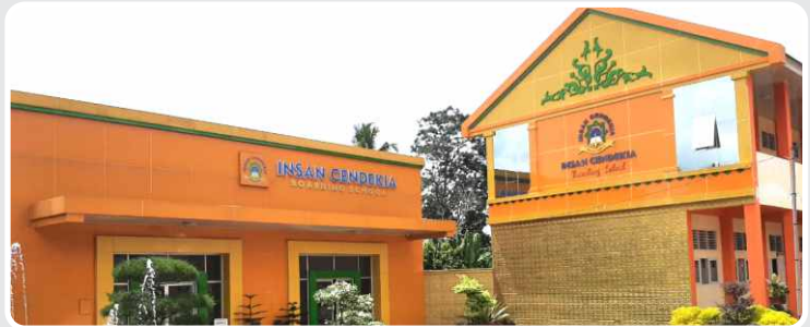
📍 ICBS Komplek Payakumbuh

Kawasan Objek Wisata Harau, Nagari Tarantang, Lima Puluh Kota, Sumatera Barat