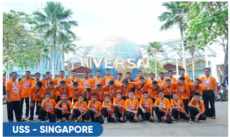
USS - SINGAPORE