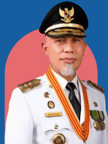
H. Mahyeldi Ansharullah, S.P. (Gubernur Sumatera Barat)

Pesantren yang terletak ditempat yang sejuk dan alam yang indah akan memudahkan santri dalam menghafal Qur'an dan menuntut ilmu, siapa saja yang mengamalkan Al-Qur'an maka Syurga baginya. Maka Hafal dan amalkanlah Al-Qur'an di pesantren terbaik ini.