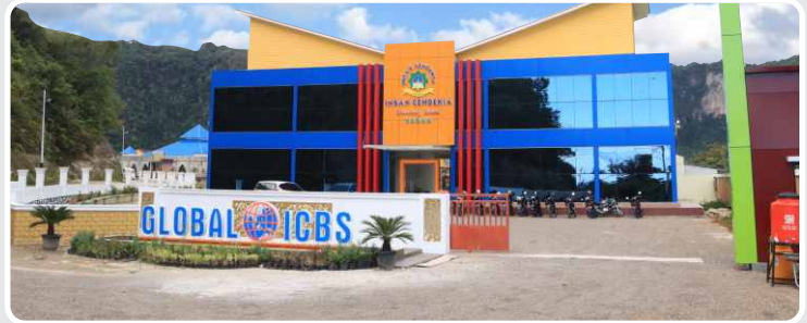
📍 ICBS Komplek Global

Kawasan Objek Wisata Harau, Nagari Tarantang, Lima Puluh Kota, Sumatera Barat