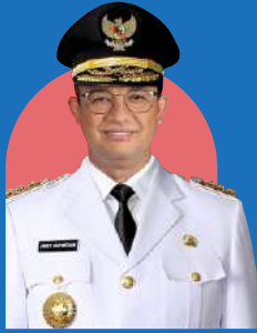
H. Anies Rosyid Baswedan, S.E., M.P.P., Ph.D (Gubernur DKI Jakarta 2017 - 2022)

ICBS merupakan ekosistem pendidikan yang mampu meningkatkan kemampuan, melatih kemandirian, dan menumbuhkan karakter dan pribadi yang cerdas, Islami dan berprestasi.