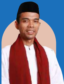
Ustadz Prof. H. Abdul Somad Batubara, Lc., D. E. S. A., Ph.D (Da'i Nasional)

ICBS merupakan lembaga pendidikan Islam hasil dari pemikiran visioner. Dengan visi dan ambisi yang luar biasa, ICBS berhasil menjadi salah satu Lembaga pendidikan terbaik di Indonesia.