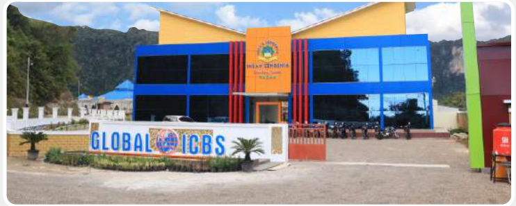
📍 ICBS Komplek Global

Kawasan Objek Wisata Harau, Nagari Tarantang, Lima Puluh Kota, Sumatera Barat