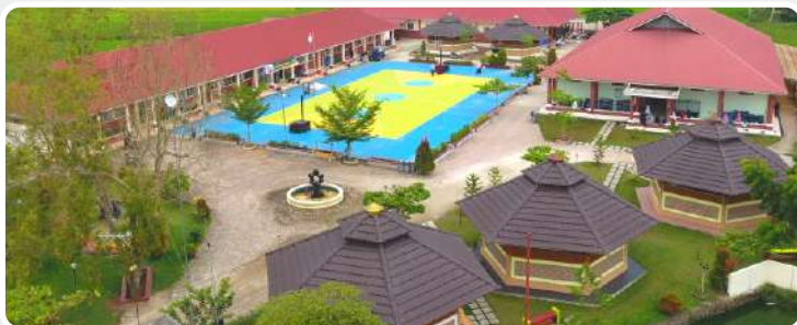
📍 ICBS Komplek Ummul Quro Lampasi

Jorong Ketinggian Nagari Sarilamak Harau, Limapuluh Kota, Sumatera Barat