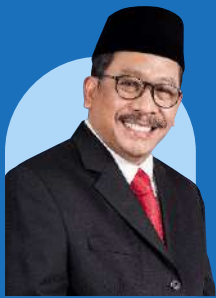
Drs. H. Zainut Tauhid Sa'adi, M.Si (Wakil Menteri Agama RI)

ICBS merupakan ekosistem pendidikan yang mampu meningkatkan kemampuan, melatih kemandirian, dan menumbuhkan karakter dan pribadi yang cerdas, Islami dan berprestasi.