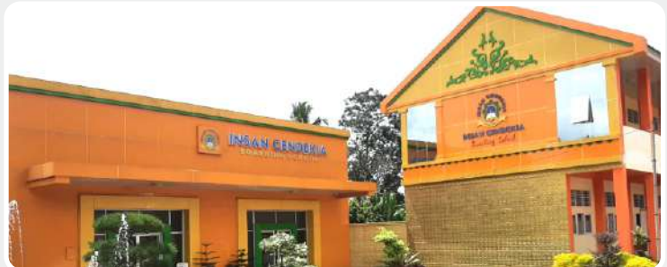
📍 ICBS Komplek Payakumbuh

Kawasan Objek Wisata Harau, Nagari Tarantang, Lima Puluh Kota, Sumatera Barat