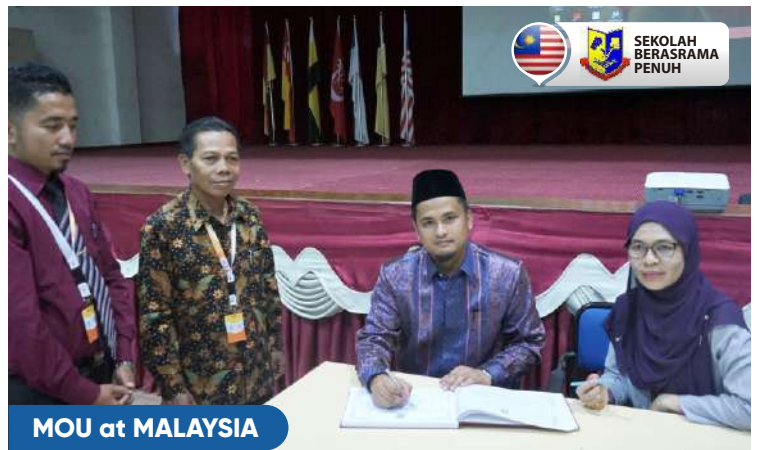
MOU at MALAYSIA