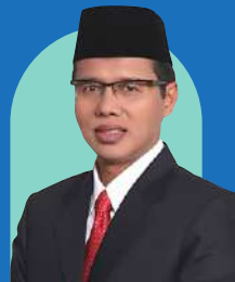
Prof. Dr. H. Irwan Prayitno, S.Psi., M.Sc. (Gubernur Sumatera Barat 2010 - 2020)

Dengan 5 kampus yang tersebar di Payakumbuh dan Limapuluh Kota, banyak sekali dampak positif dari keberadaan ICBS. Kehadiran ICBS telah menghadirkan calon-calon ulama dan juga berkontribusi bagi kebaikan dan kemajuan pendidikan di Indonesia.