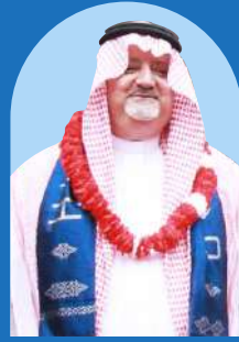
Syaikh 'Isham 'Abid Ats Tsaqafy (Duta Besar Kerjaan Arab Saudi Untuk Indonesia)

Masya Allah.. Di ICBS santri di didik disiplin selain fasilitas juga lokasinya sangat bagus untuk belajar, Harapan saya kepada santri agar memanfaatkan untuk belajar dengan sebaik - baiknya, " akan diangkat derajat orng yang berilmu dan beriman" Alhamdulillah..