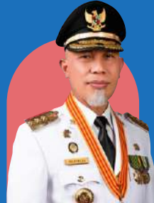
H. Mahyeldi Ansharullah, S.P. (Gubernur Sumatera Barat)

Pesantren yang terletak ditempat yang sejuk dan alam yang indah akan memudahkan santri dalam menghafal Qur'an dan menuntut ilmu, siapa saja yang mengamalkan Al-Qur'an maka Syurga baginya. Maka Hafal dan amalkanlah Al-Qur'an di pesantren terbaik ini.