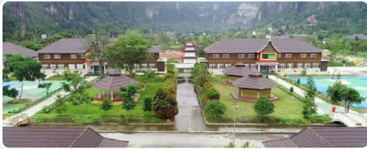
📍 ICBS Komplek Harau

"Allah akan meninggikan orang-orang yang beriman di antaramu dan orang-orang yang diberi ilmu pengetahuan beberapa derajat." (QS. Al Mujadalah : 11)