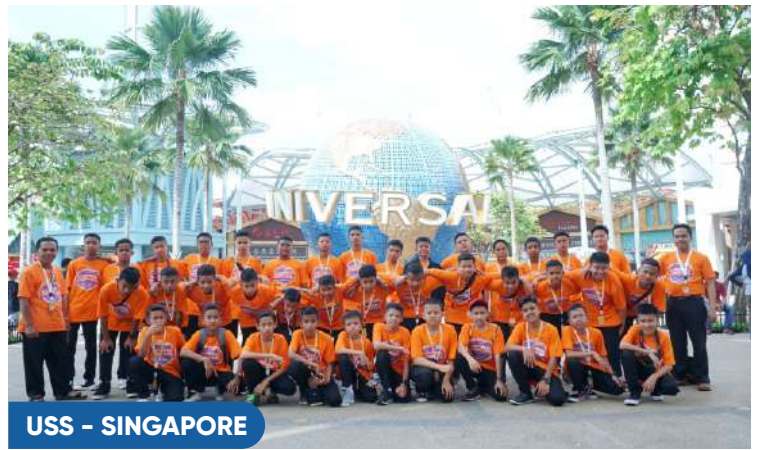
USS - SINGAPORE